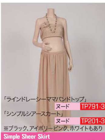
「ラインドレーシーママバンドトップ」