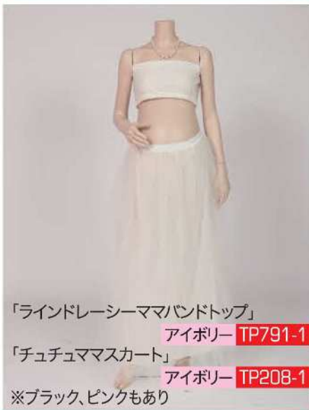
「ラインドレーシーママバンドトップ」