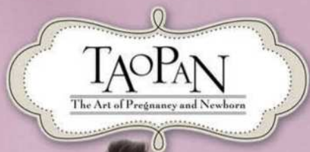
ベラビューティーママガウン ヌード TP601