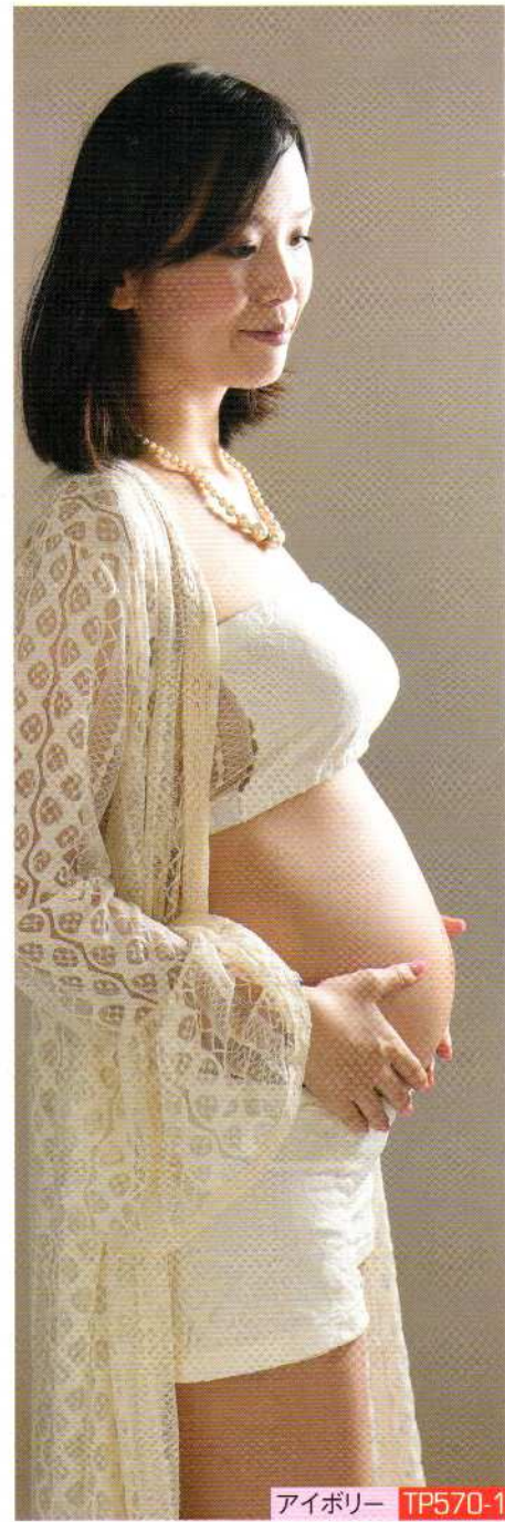
Lucia kimono 3-Piece Set 「ルシアキモノセット」